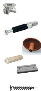
Комплектовочная ведомость на фурнитуру

Шурупами 3 x 16, закрепите наконечники поз. 14 на нижнюю крышку поз.1. Эксцентриковой стяжкой поз. 10, и шкантами поз. 13 соедините между собой стенки вертикальные поз. 2, 3 и затем, с крышками поз. 1. Установите заглушки поз.12.